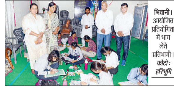
भिवानी। आयोजित प्रतियोगिता में भाग लेते प्रतिभागी।