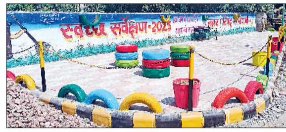
भिवानी। पंचायत भवन के पास अवैध कचरा प्वाइंट बंद कर तैयार किया गया सेल्फी प्वाइंट व सौंदर्यीकरण से पूर्व पंचायत भवन के पास पड़ा होस्पिटलों का बायोवेस्ट व रेस्टोरेट का कचरा।

नगर परिषद प्रशासन ने शहर के 12 अवैध कचरा प्वाइंटों को खत्म कर उनका सौंदर्यीकरण किया है और उन्हें सुंदर रूप देकर सेल्फी प्वाइंट में तब्दील कर दिया है, जिसे देखकर महसूस भी नहीं होता कि कभी यहाँ कचरे का ढेर भी होता होगा, अब लोग यहां पर अपनी सेल्फी लेते नजर आएंगे। नगर परिषद प्रशासन ने वैसे तो शहर के अंदर व बाहरी क्षेत्र के लगभग 35 से 40 अवैध कचरा प्वाइंट पूर्णरूप से बंद कर दिए हैं और वहां पर नप ने अपना सफाई कर्मचारी भी तैनात किया है, जो लोगों को घर के दरवाजे पर आने वाली टिप्पर गाड़ी में कूड़ा डालने के लिए जागरूक कर रहा है। शहर के पंचायत भवन के पास, कृष्णा कॉलोनी मोड, फूलादेवी स्कूल, हनुमान गेट, रैडक्रॉस के सामने, महम रोड बड़चौक व हांसी रोड केएम स्कूल के पास अवैध कचरा प्वाइंट सहित 12 प्वाइंटों को बंद कर उनका सेल्फी प्वाइंट के रूप