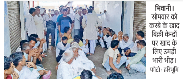
भिवानी। सोमवार को कस्बे के खाद बिक्री केन्द्र पर खाद के लिए उमड़ी भारी भीड़।

विभागों ने अपनी स्टॉल लगाकर ग्रामीणों को जनहितकारी योजनाओं की जानकारी दी। अधिकारियों-कर्मचारियों ने विभागीय योजनाओं की जानकारी देते हुए ग्रामीणों को उनका पूर्ण लाभ उठाने के लिए प्रोत्साहित किया। विभागीय अधिकारियों ने मंच से भी अपनी योजनाओं की विस्तृत जानकारी देते हुए उनका फायदा उठाने की पूर्ण प्रक्रिया से अवगत करवाया।