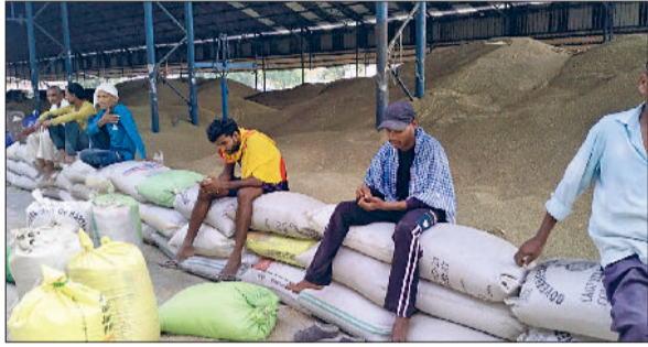
भिवानी। बाजरे की खरीद शुरू करवाए जाने की मांग को लेकर धरने पर बैठे किसान और बाजरे की खरीद न होने के बाद आराम फरमाते मजदूर।